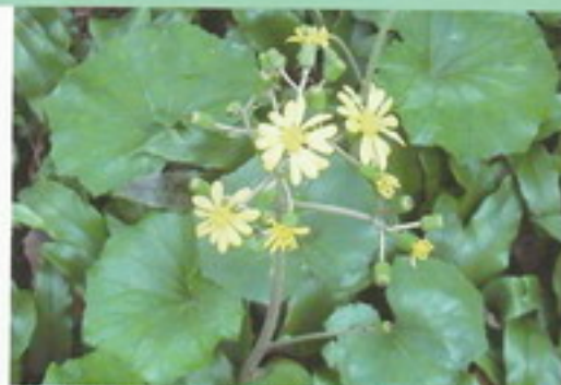
Petasites japonicum (farfaraccio)

Perenne rizomatosa spogliante, con foglie rotonde che emergono dai fiori color crema-verdastro in marzo-aprile.