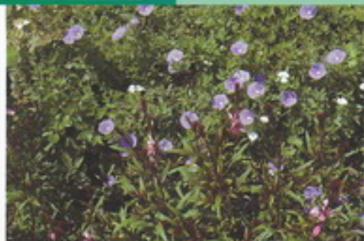
Convolvulus mauritanicus o sabatius

Tappezzante perenne che nei climi freddi è trattata come annuale, fiori dal blu al violetto in estate.