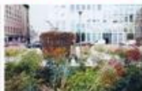
Giardino contemporaneo. Capri e granocce in via Belfra

giardino di gusto contemporaneo, ancora poco noto, è accorto. Anche a gennaio, nelle giornate più tepide, le punte, posizionare strategicamente, invitano a una sosta». La quinta è scenografica, con la torre medievale di Palazzo dei Giuristi che svetta fra moderni edifici bianchi — e a terra, da un oblio trasparente, purtroppo in pessime condizioni, si intravedono i resti del mosaico di epoca romana, del palazzo