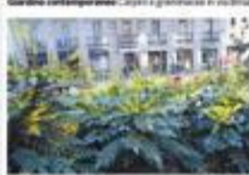
Via Molino delle Armi. Il gusto della Malombra in fiore

imperiale di Maximiliano — «il disegno del giardino è semplice e con vasti spazi che rendono lo spazio multifunzionale: nel limitare ci sono le maglie da fiore, ora piene di gemme vellutate, poi avanzano siepi di cespugli disposti in filari, alternati alle aiuole di granocce, vecchie ma con i volani intatti.