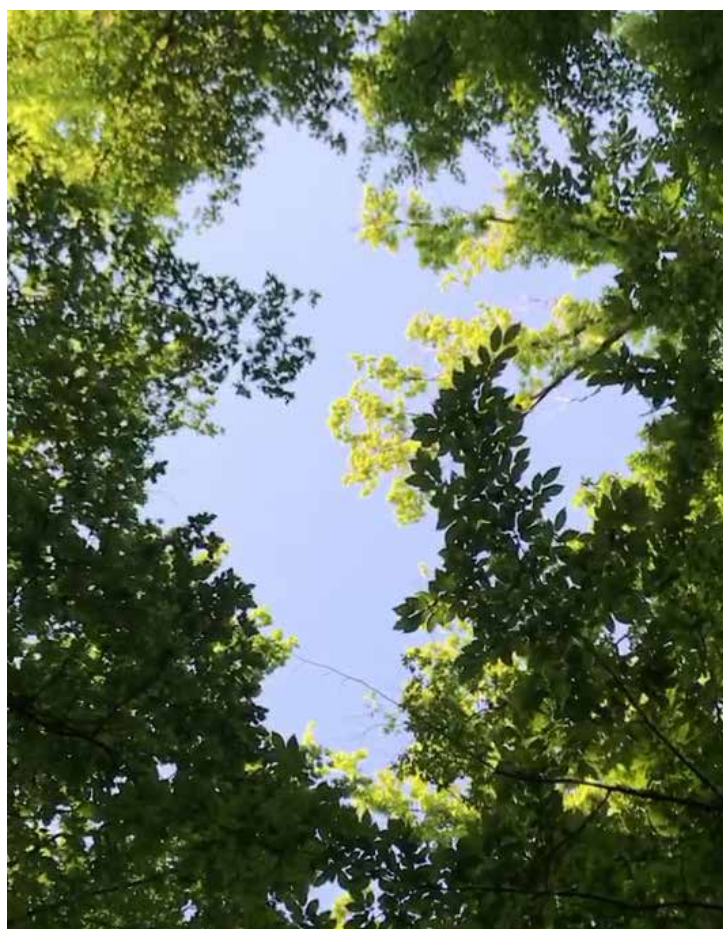
Il soffitto della galleria d'arte

Percorrendo un sentiero sterrato, ai margini di un vivaio, si accede a un altro terreno erboso lambito su un fianco da un viale di betulle.