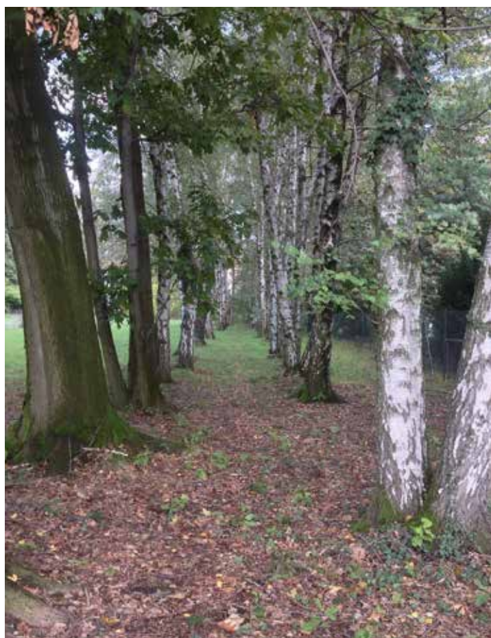
Il corridoio della galleria d'arte

Un viale di betulle è il corridoio, il cielo tra i rami è il soffitto. * *