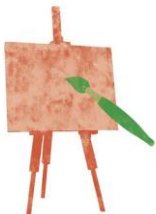
ILLUSTRAZIONE BOTANICA I: IL DISEGNO

Esercitazioni sulla matita colorata: una valida alternativa all'acquerello