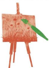
ILLUSTRAZIONE BOTANICA 2: L'ACQUERELLO

Qualche accenno alle possibili variazioni sul tema: la gouache o acquerello opaco; la tecnica mista acquerello/matite colorate