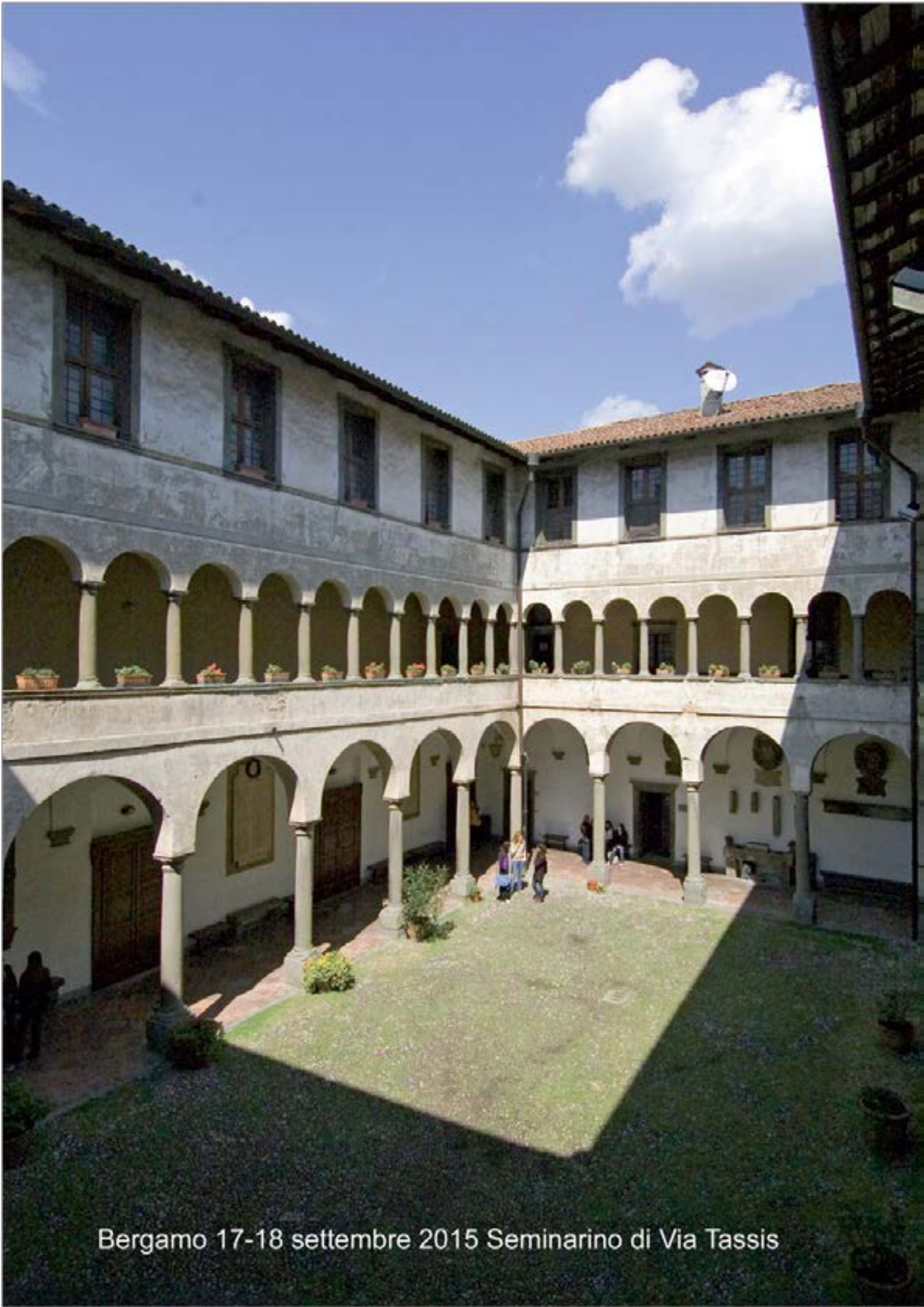
Bergamo 17-18 settembre 2015 Seminarino di Via Tassis