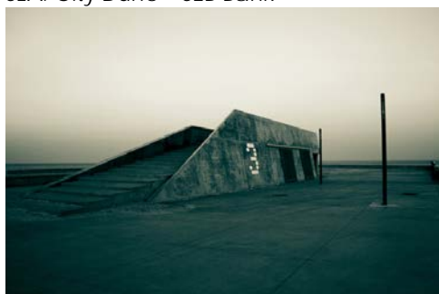
Amager Beach Park