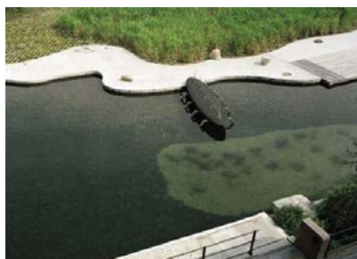
Anchor Park - Malmo