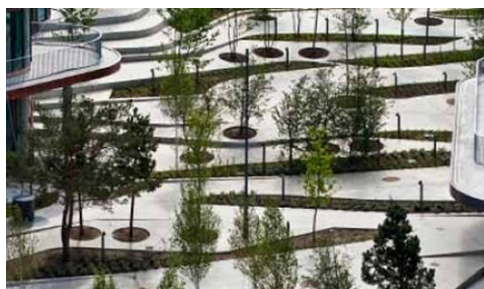
SLA: City Dune - SEB Bank